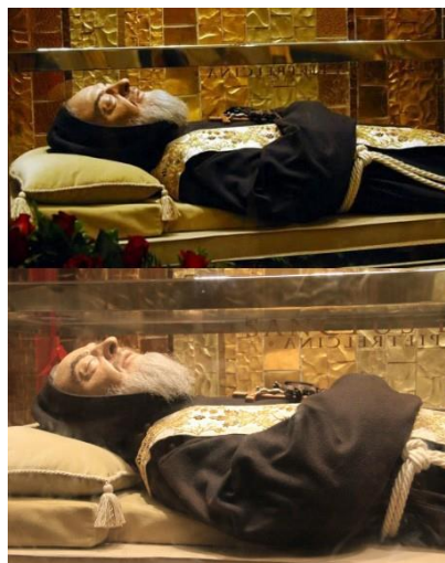
Corpo incorrupto de So Pio de Pietrelcina

No captulo seguinte voc descobrir como Padre Pio pensava e ter acesso a depoimentos dos Papas sobre o nosso amado Santo.