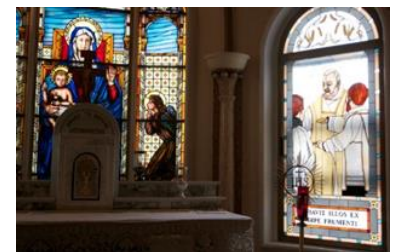
Capela do hospital Sollievo della Sofferenza