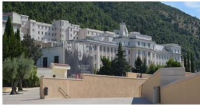
Frente do hospital idealizado por Padre Pio

“Esta é uma criatura que a Divina Providência, com a ajuda de vocês, criou.”