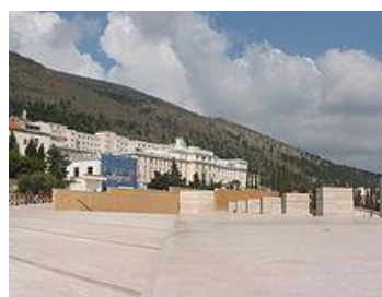
Hospital Casa Alívio do Sofrimento (São Giovanni Rotondo)

VAMOS, NESTE MOMENTO DE SOFRIMENTO QUE ESTAMOS PASSANDO EM NOSSO PAÍS, PELA PANDEMIA DO CORONAVIRUS, ORAR E PEDIR A INTERCESSÃO DE SÃO PIO.